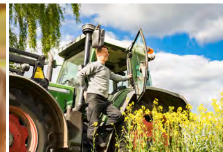
Fachspezifische Schulungen S. 41