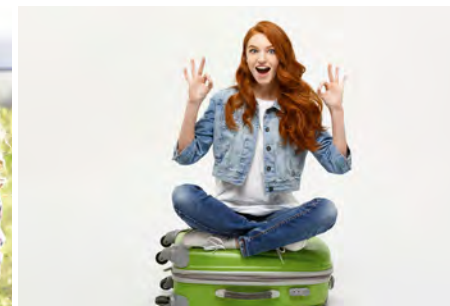
Internationale Praktika und Seminarreisen S. 59