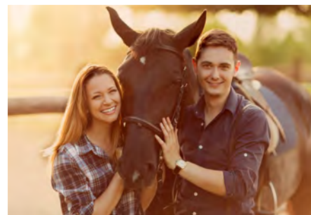
Reittourismus S. 37