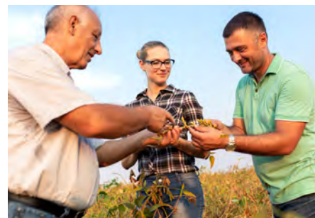
Schulungen für Fach- und Führungskräfte S. 11