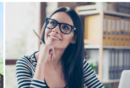
Schulungen für Mitarbeiter im Agrarbüro S. 25